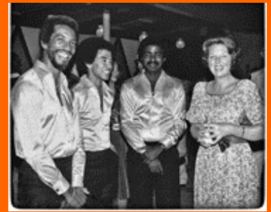
Trio Huasteca etreteniendo Prinses Beatrix na Hotel Talk of The Town Aruba